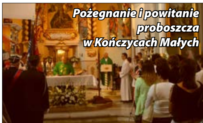
Pożegnanie i powitanie proboszcza w Kończycach Małych