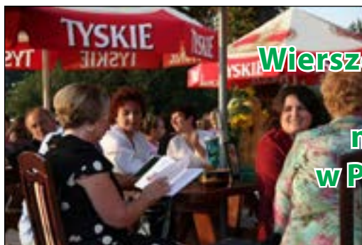
Wierszogranie z nami na Kępcę w Przystani