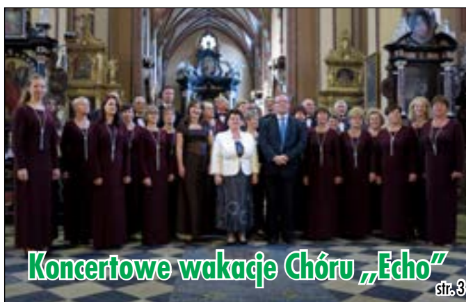
Koncertowe wakacje Chóru „Echo”