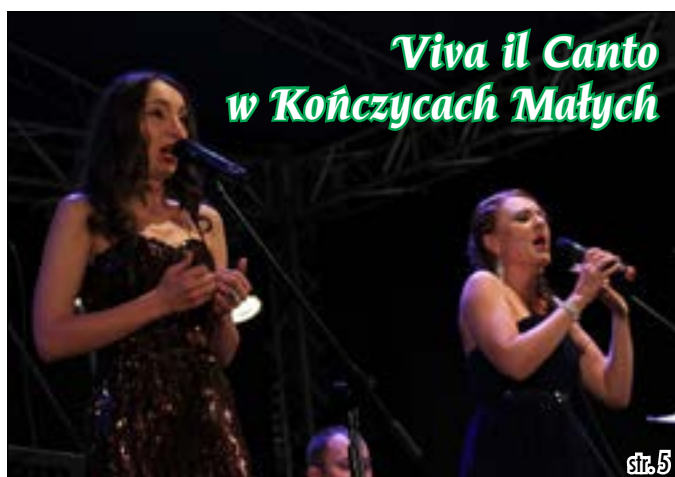
Viva il Canto w Kończycach Małych

MIESIĘCZNIK NR 8 (174) ROK XIV SIERPIEŃ 2013